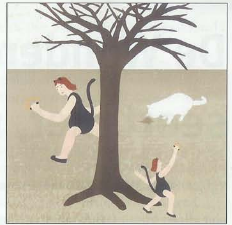
Gastillustratie Annelien Cael

al vijf jaar lang dé dag waarop kinderen over heel Antwerpen op hun potlood sabbelen en peinzend het raam uitkijken, om zich dan op hun papier te storten en het verhaal van hun leven te schrijven. Het gekozen moment is geen toeval: na vijf maanden beschikken de eersteklassers over voldoende techniek en woordenschat om een verhaal op papier te krijgen.